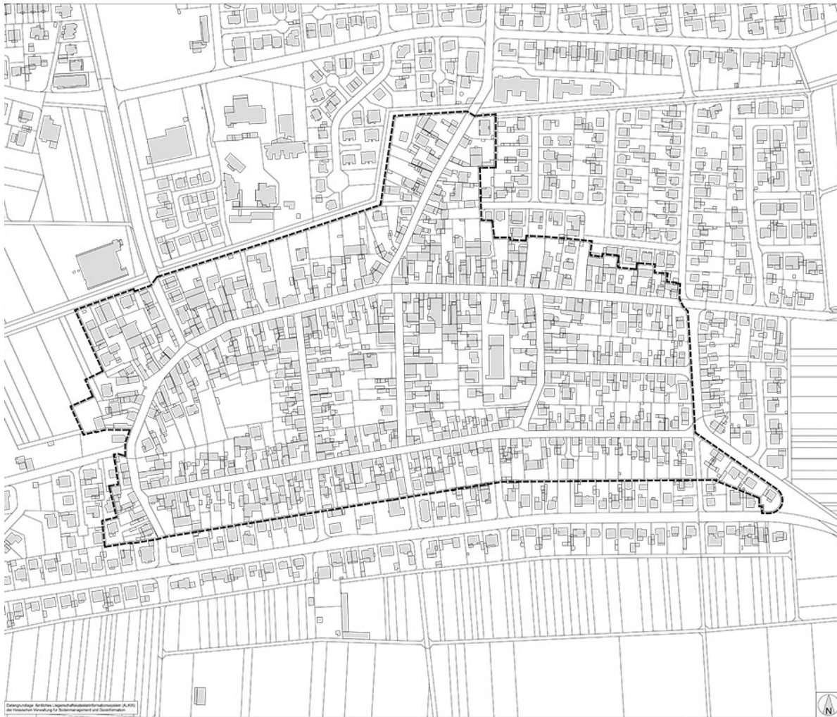
Lage des räumlichen Geltungsbereichs des Bebauungsplans „Alter Ortskern Worfelden“ (unmaßstäblich)